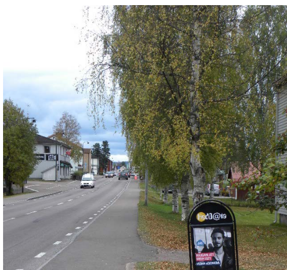
Godkänd trotoarprat som inte påverkar framkomligheten för gångare

Fastighetsägare är alltid den som är ytterst ansvarig för vad som sker på fastigheten. D.v.s. att om någon annan (än fastighetsägaren) olovligt uppfört skylt är det trots detta fastighetsägarens ansvar och det är oftast denne som riskerar påföljder. Om olovligt uppförd skyltning tas bort innan beslut