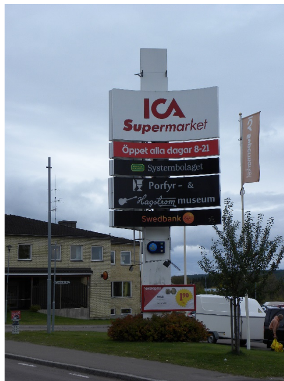
Skyltpylon i centrum

Höjd styrs av detaljplan eller av verksamhetslokalens totalhöjd, om byggnadens totalhöjd är mycket låg kan avsteg från denna riktlinje göras. Eventuell belysning av pyloner ska ske på ett vis så att inte trafikanter bländas.