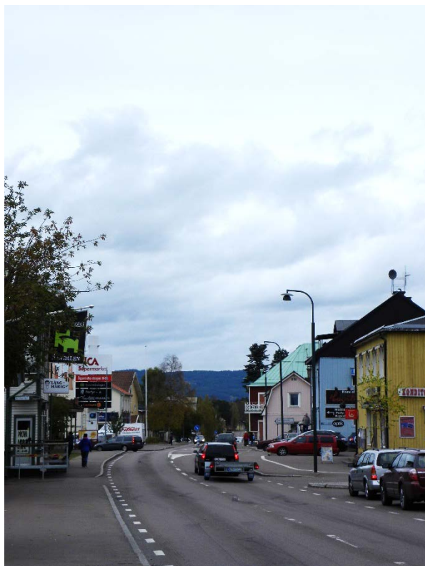
Längs Dalgatan finns diverse skyltar i olika storlekar och former.

I policyn beskrivs de mål som Älvdalens kommun vill uppnå samt lagstiftning och gällande regler för skyltning. Policyn ska också vara vägledande och fungera som ett stöd för bygglovshandläggaren i avvägningen mellan olika intressen.